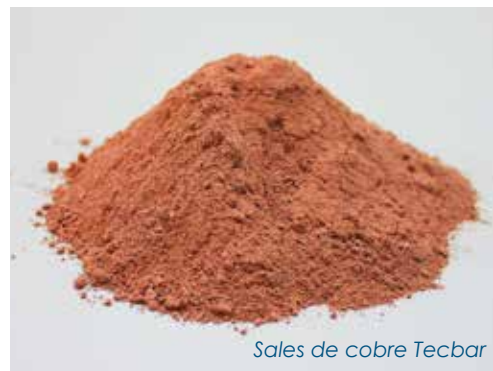
Sales de cobre Tecbar