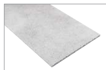
Gris Perla 89706-1 610 x 305 mm Caja 1.88 mt2