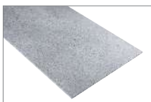
Gris Acero 1187H-1 610 x 305 mm Caja 1.88 mt2

En Feltrex tenemos una gran variedad de formatos y colores para que puedas renovar tus espacios con un revestimiento de piso que permite instalarlos tanto en un espacio comercial como en el comedor, cocina o baño de tu casa.